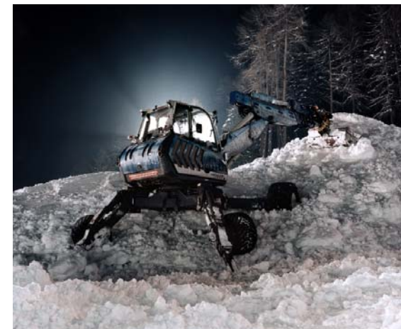
JULES SPINATSCH, SNOW MANAGEMENT, UNIT PAMM, 2005, C-print, 31 1/2 x 39 1/2" / 80 x 100 cm.

Though we are unable to take the entire picture in at once, we can read its parts in a number of ways. We can study it as a mass of signs, a fabric of cultural codes, and a blend of culture and commerce that is emblematic of the early twenty-first century. But we can also devote ourselves to the details of individual