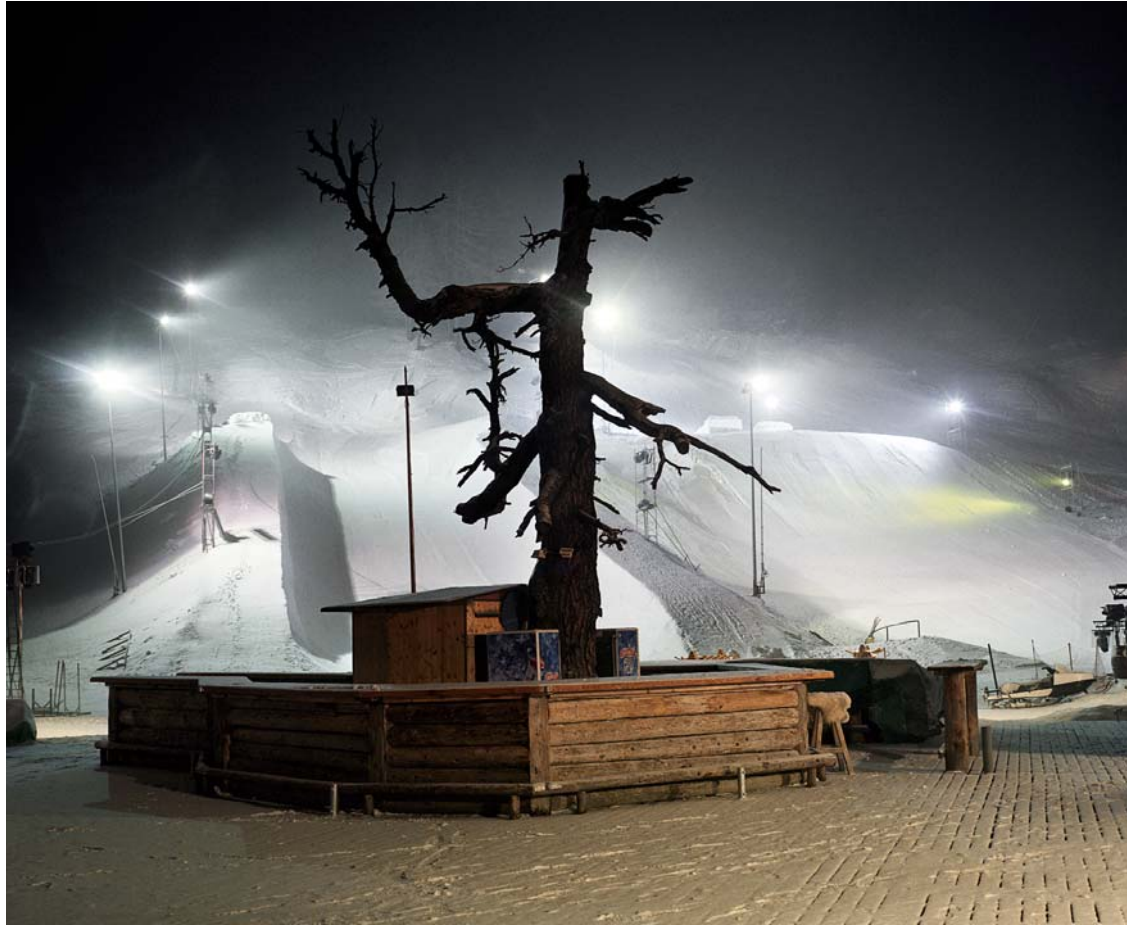
JULES SPINATSCH, SNOW MANAGEMENT, UNIT BT/SCENE B3, 2004, C-print, 31 1/2 x 39 1/2" / 80 x 100 cm.

tranten lässt sich auf dem Panorama in seiner zeitlichen Entfaltung beobachten, gleichzeitig wird ein Überblick über die gewaltige Sicherheitsarchitektur geboten, während sich von links nach rechts der Wechsel von Nacht zu Tag verfolgen lässt.