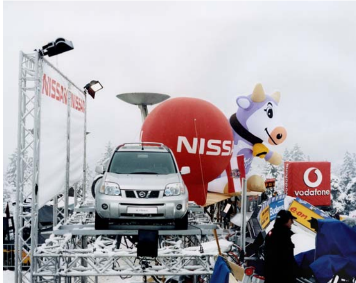
JULES SPINATSCH, SNOW MANAGEMENT, UNIT MNBEVO, 2005, C-print, 10 1/4 x 13 3/8" / 26 x 34 cm.

ungsspiels Schweiz – Frankreich am 8. Oktober 2005 nahm die Kamera dreitausend Einzelbilder auf, schwenkte dabei während der Dauer des Spiels (zusätzlich einer halben Stunde vor und nach dem Spiel, während insgesamt 185 Minuten) von links nach rechts über das Spielfeld und tastete es von oben nach unten ab. Die entstandenen Bilder montierte Spinatsch zu einem 4 x 9 Meter langen Panorama des Spielfeldes, das von links nach rechts betrachtet zugleich die Dauer des Spiels in Einzelmomente zerlegt – die Zeit wird hier zum Raum. Der Ball ist nie zu sehen, die Position der Spieler im Gesamtbild entspricht keinem Moment des Spiels. Wir sehen statt dessen das prismatisch in Tausende von Einzelmomente aufgelöste Stadion. Aus der Distanz betrachtet, fügen sich die Bilder zu einer Panoramansicht, die sich bei näherem Betrachten in Wirklichkeitsfragmente auflöst: ein Gewirr von Zuschauern, Ordnungshütern, Medienschaaffenden, Sanitätern, Fußballspielern, Balljungen und Schiedsrichtern, Scheinwerfern, Kameras, Laptops, Mikrofonen, Fahnen, Transparenten und unzähligen Werbebannern. Während auf den Bildern in der linken