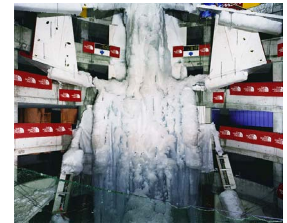
JULES SPINATSCH, SNOW MANAGEMENT, 200X, C-print, xxx X xxx" / xxx X xxx cm.

nicht, aus diesem Mythos Profit zu schlagen. Im Laufe der letzten zwei Jahrhunderte verwandelten sie die unberührte Bergwelt in eine High-Tech-Eventlandschaft, die den höchstmöglichen Gewinn erbringen soll. In SNOW MANAGEMENT zeigt Spinatsch, wie nachts in den Bergen die Skipisten präpariert werden. Im kalten Flutlicht sprühen die Schneekanonen, Pistenfahrzeugen planen die Abhänge, touristisches Naturerlebnis wird hergestellt. In seinen Nachtlandschaften sind keine Berge zu entdecken, vielmehr erinnert ihre kalte Leere an Standbilder aus einem Science-Fiction-Film, die zeigen, wie die Oberfläche eines unwirtlichen Planeten bewohnbar gemacht wird. Auch das Naturspektakel der Schweizer Alpen entpuppt sich als Inszenierung, ebenso wie Fussballspiel und Gipfeltreffen. Spinatsch zeigt in seinen Arbeiten Technik, Inszenierung und Mediation als Grundbedingungen der Gegenwart auf und erlaubt dem Betrachter einen Blick hinter die Kulissen dessen zu werfen, was ihm als «Wirklichkeit» verkauft wird. Spinatsch bleibt dabei immer nüchtern und unsentimental, unbeleckt von Nostalgie und Kulturpessimismus. Gerade diese Trockenheit verleiht seinen Arbeiten eine Weit- und Klarheit, die beklemmender als manche im Detail ausgemalte Endzeitvision wirkt.