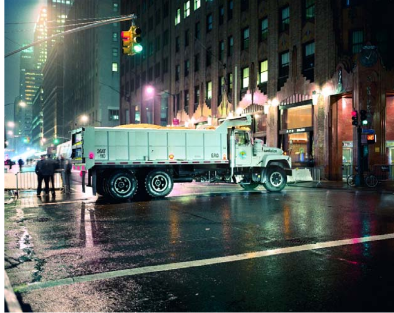
JULES SPINATSCH, TEMPORARY DISCOMFORT , 2003, New York, XXXXXXXXXXXXXXXXXXXXXXXX

The backdrop of the Big Apple at night makes the scene look like something out of a movie, a thriller or even film noir. In each chapter, Spinatsch combines straightforward observation, as in the domain of security management, with humor and a delight in the artificiality of these events. His studies expose the structure that underlies such summit meetings as prerequisite to contemporary politics, representing them as elaborately staged productions, in which neither participants nor demonstrators can escape the logic of the spectacle.