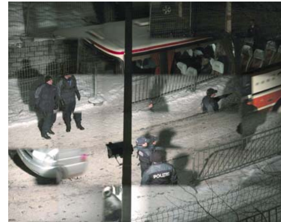
JULES SPINATSCH, TEMPORARY DISCOMFORT, 2003, Davos, XXXXXXXXXXXXXXXXXXXXXXXXXX

Spinatsch investigates places under exceptional conditions, shut down and under military control. He shows Genoa at the height of summer, in searing heat and deserted, like a painting by De Chirico. Or downtown Geneva during the G8 summit in nearby Évian, where shop windows and signage were secured behind yellow boards to protect them from the rage of demonstrators, effectively concealing all company logos. The omnipresent yellow surfaces ironically make the city seem like an oversized minimalist sculpture. Another series shows Davos at night flooded by artificial light, crisscrossed with barbed wire fences, under the surveillance of the army and security agents. The mood is quite the opposite in the artist's pictures of the WEF in New York, where he observes security agents watching and waiting half asleep between roadblocks and broadcasting vans.