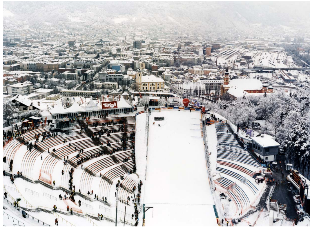
JULES SPINATSCH, SNOW MANAGEMENT, SCENE II, 2005, C-print, 31 1/2 x 39 1/2" / 80 x 100 cm.

A compact rendition of the essence of reality: this describes one of the great promises of photography and gives the merciless limitations of the medium—the linear treatment and fragmentation of reality—a fair chance. Should photography succeed in satisfying this claim, then one fleeting gaze, one single gesture would be understood to offer the key to an