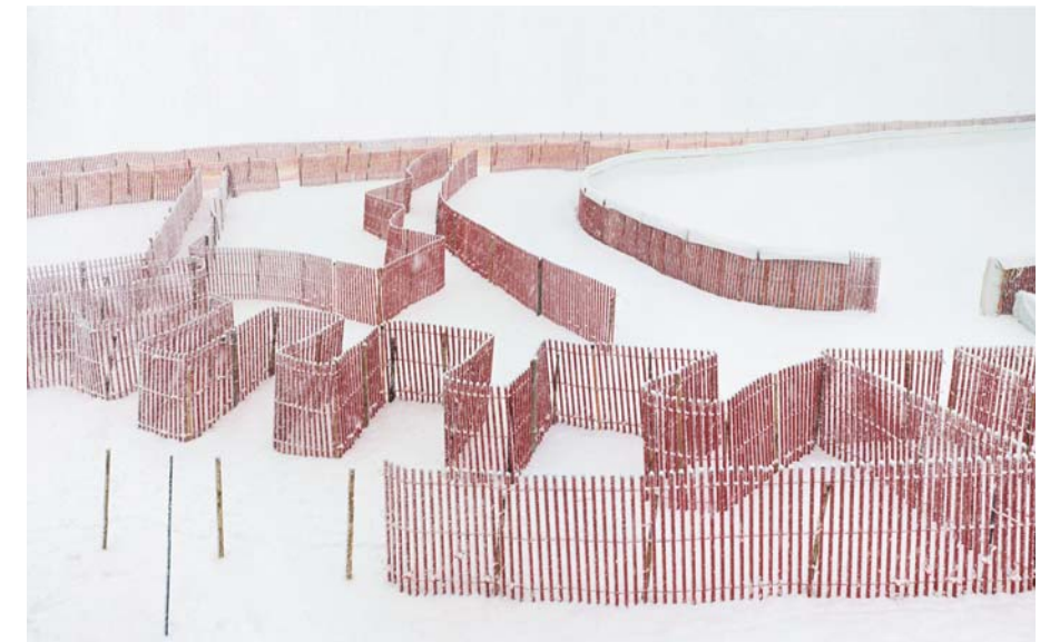
JULES SPINATSCH, SNOW MANAGEMENT, SCENE KMP, 2005, C-print, 28 3/8 x 49 1/2" / 72 x 126 cm.

Doch die computergesteuerte Kamera lässt sich nicht nur als Metapher für Wahrnehmung und Erinnerung lesen, sie lädt zu weit unheimlicheren Deutungen ein. Ihre panoptische Perspektive auf das Geschehen verweist auf die Schreckensvision totaler Überwachung, eines unmenschlichen allerfassenden künstlichen Auges: der Wunschtraum der Sicherheitstechnologen im Zeitalter des Terrors. Spinatsch setzte Netzwerkkameras bereits in einer früheren Arbeit, TEMPORARY DISCOMFORT IV / PULVER GUT, ein, um einen dystopischen Überwachungsallraum zu simulieren. Während des World Economic Forums 2003 in Davos, als Globalisierungsgegner das Treffen von Spitzenkräften aus Politik und Wirtschaft mit einer Demonstration stören wollten, zeichnete Spinatsch mit drei Netzwerkkameras ein Raum-Zeit-Panorama des Kurorts Davos auf, der für die Dauer des WEF zu einer Hochsicherheitszone wurde. Das Katz-und-Maus-Spiel von Polizei und Demons-